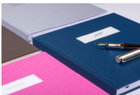
Memory Book, 80 Seiten, Japanbindung, 19,8 x 24 x 1,5 cm, UVP: € 33.

Ein echter Hingucker unter den Weihnachtsgeschenken ist auch das Memory Book von Gmund Papier. Ob als Rezept- oder Gästebuch, für Erinnerungen oder Notizen – das Memory Book lädt zum Schreiben und Zeichnen ein. Ein dicker Einband hält die weißen Seiten mit dezenten Wasserzeichen zusammen. Das Memory Book ist ein Buch voller exquisiter Details, wie zum Beispiel die außergewöhnliche Japanbindung. Bei den verschiedenen Farbdesigns und den vielfältigen Einsatzmöglichkeiten legt man dem Empfänger ein ganz besonderes Schmuckstück unter den Weihnachtsbaum.